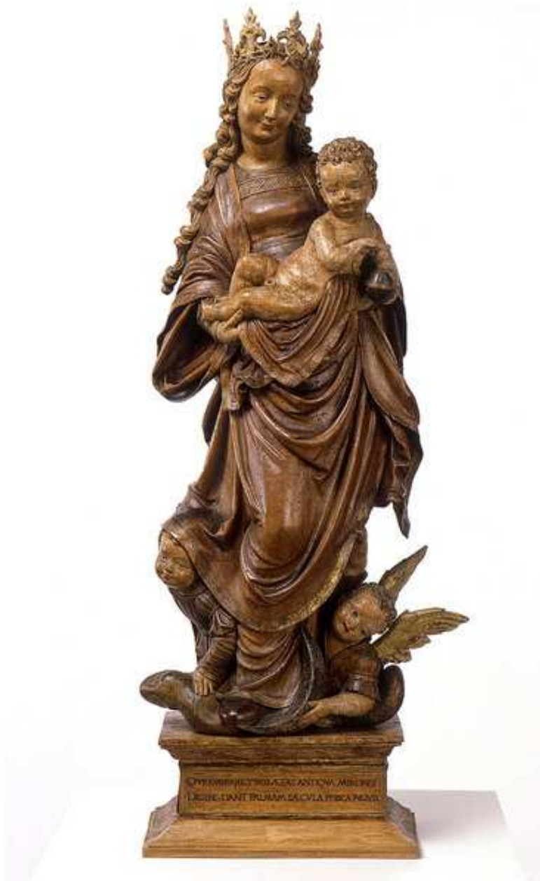
Daniel Mauch, Berselius-Madonna

Wie kein zweiter Künstler seiner Generation reagiert Daniel Mauch (1477-1540) auf die tiefgreifenden Umbrüche der frühen Neuzeit. Mauch setzt als einer der ersten deutschen Bildhauer in seinem Werk Formen und Motive des neuen Stils der Renaissance um. Er gestaltete Altäre und Skulpturen. Das Ulmer Museum widmet dem grossen Unbekannten aus der Tradition der Ulmer Bildschnitzer zum ersten Mal eine Ausstellung. Durch die Wirren der Reformation Die Ausstellung ist äusserst sehenswert!! Der Katalog ist hervorragend verfasst.